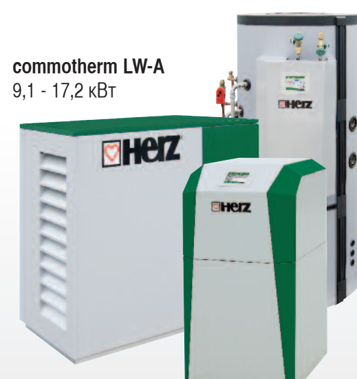
commothem LW-A 9,1 - 17,2 кВт