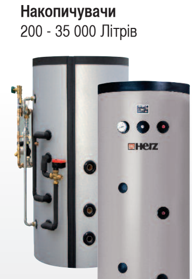
Накопичувачи 200 - 35 000 Літрів